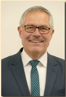
1 Peter Kraus 1. Bürgermeister Dipl.-Verwaltungswirt (FH)